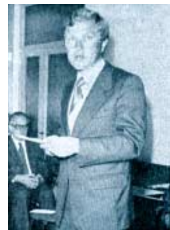
«Stadtpräsident Hermann Fehr überbrachte die Glückwünsche der Behörden.»