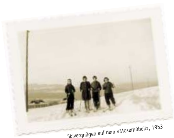
Skivergnügen auf dem «Moserhübeli», 1953

Viele, insbesondere auch jüngere Ärzte hatten zunehmend Mühe, ihre Privatpatienten für Spitalbehandlungen unterzubringen. Die Idee, aus eigenen Kräften eine Klinik zu errichten, fiel deshalb auf fruchtbaren Boden und gewann immer mehr Anhänger – nicht nur innerhalb der Ärzteschaft, sondern auch aus Apothekerkreisen. So konnte bereits am 29. November 1950 der Gründungsakt der Privatklinik Linde AG vollzogen werden.