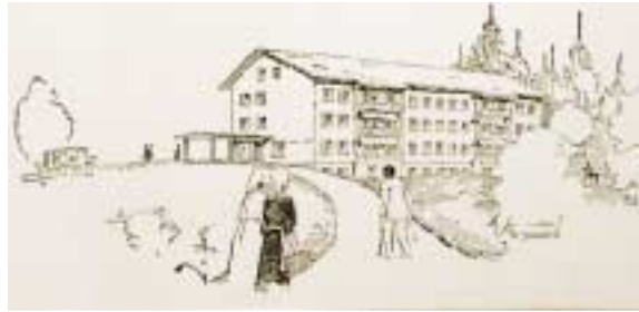
Zur Eröffnung der Klinik Linde, Illustration im Bieler Tagblatt