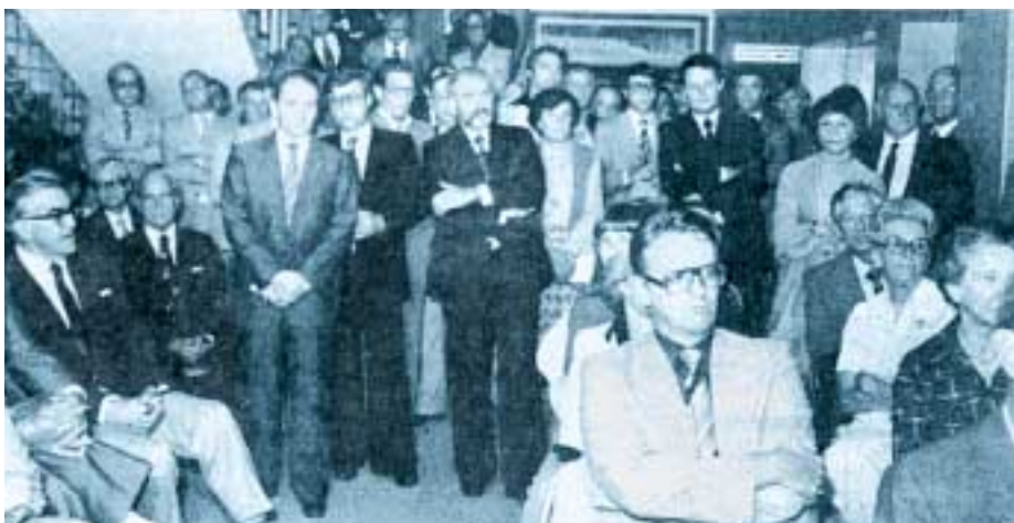
Aus dem Bieler Tagblatt vom 20.8.1979: «Über 100 Personen fanden sich zur offiziellen Feier zum 25-jährigen Bestehen der Klinik Linde ein.»

Das 25-jährige Jubiläum der Klinik Linde bot den Verantwortlichen willkommene Gelegenheit, Rückschau auf die vergangenen Jahre zu halten und die eigene Position im Gesundheitswesen zu reflektieren. Die Bilanz fiel durchaus erfreulich aus. Und der Wille, den guten Ruf der Klinik Linde als modernes Spital mit individueller, persönlicher Betreuung der Patientinnen und Patienten weiter zu fördern, wurde gleich mit neuen Taten untermauert.