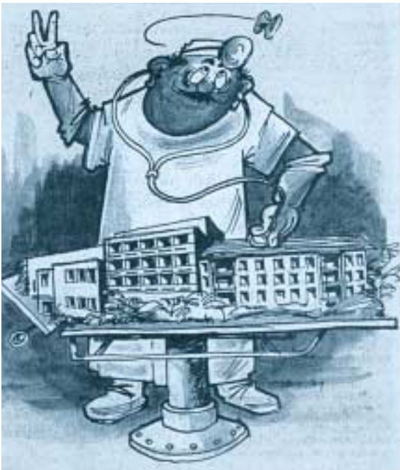
«25 Jahre Privatklinik Linde ...kerngesund ...o.k. für weitere 25 Jahre!!!»

25 Jahre nach der Klinikgründung konnten die Verantwortlichen anlässlich einer eindrucksvollen Feier die Sympathiebezeugungen der Behörden, der Vertreter der öffentlichen Spitäler der Region und zahlreicher Privatspitäler, aber auch der Bieler Bevölkerung entgegennehmen. Damit wurde die grosse Bedeutung unterstrichen, die die Klinik Linde für die Pflege und Behandlung von Patienten der Region erlangt hatte. Auch von den Behörden wurde die Privatklinik mittlerweile nicht mehr als Konkurrentin der öffentlichen Spitäler wahrgenommen, sondern als deren Partnerin anerkannt.